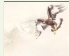
● "De eerste vlucht (jonge steenaarend)", aquarel, Renso Tamsse.

droog mogelijk op aquarelboard aanbrengt. „Ik hanteer het penseel net als een potlood.” Het boek "Renso Tamsse. Wild van Europa", dat in november verschijnt, bundelt een selectie van zijn realistische schilderijen. Tamsse doet in 2006 opnieuw een poging om bij Birds in Art te komen. „De selectie is volgens mij ook een kwestie van geluk. Het verbaast me hoe de juryering soms totstandkomt. Ik ken talentvolle collega's die niet toegelaten worden. In de catalogus zie ik namelijk ook mindere werken. Mogelijk speelt de smaak van de jury een rol, maar dat geeft toch te denken.”