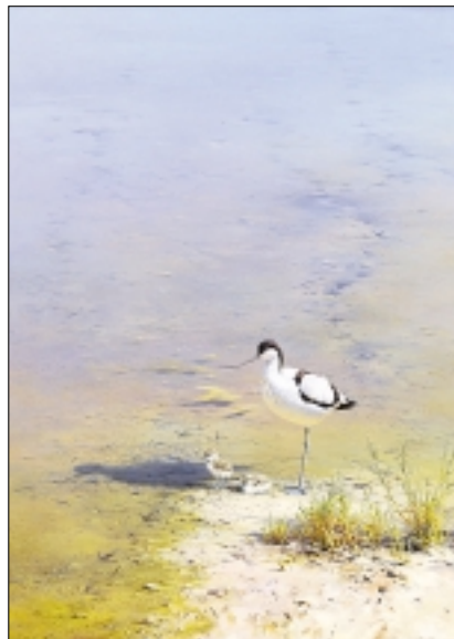
● "Avocet and Chicks" (kluut met jongen).

De tentoonstelling "Birds in Art" is tot 13 november te bezichtigen in het Leigh Yawkey Woodson Art Museum te Wausau (Wisconsin, VS). Meer informatie: www.lywam.org en www.wildlife-art.nl .