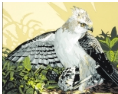
● "This is my chicken" (spitskuifarend).