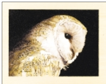
● "Jaspers" (kerkuil).

Houtbranden en acrylverf op Amerikaanse linde, Haruki Koizumi