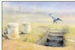
● "No Time to Lose", olieverf op paneel, door Ulco Glimmerveen.

Vaag op de achtergrond zijn de Twin Towers zichtbaar, maar verder doet het schilderij aan een oosters woestijnlandschap denken. Een secretarisvogel maakt zich snel uit de voeten. Drie schijnbaar onvernegbare zaken. „No Time to Lose” (geen tijd te verliezen), de inzending van Ulco Glimmerveen voor Birds in Art 2005, staat bol van symboliek. Enige kennis van het gedrag van de langpotige Sagittarius serpentarius is vereist om het verband met de terreuraanslag in New York te leggen. „Het dier jaagt op prooi en in open droge gebieden en is heel capabel in het doden van slangen en ratten.” De uitleg verradt de interesse van